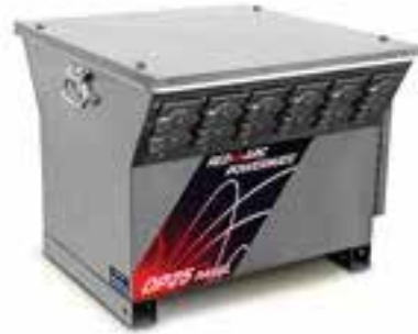
Panneau de distribution abaisseur de tension