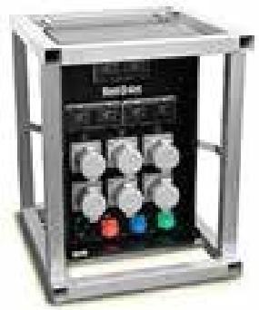
Panneau de distribution 480V

L'équipe de techniciens qualifiés de Red-D-Arc s'assure que vous disposez d'un système de distribution électrique sûr, fiable et efficace pour votre prochain travail ou projet.