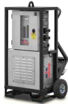
Panneau de distribution style chariot